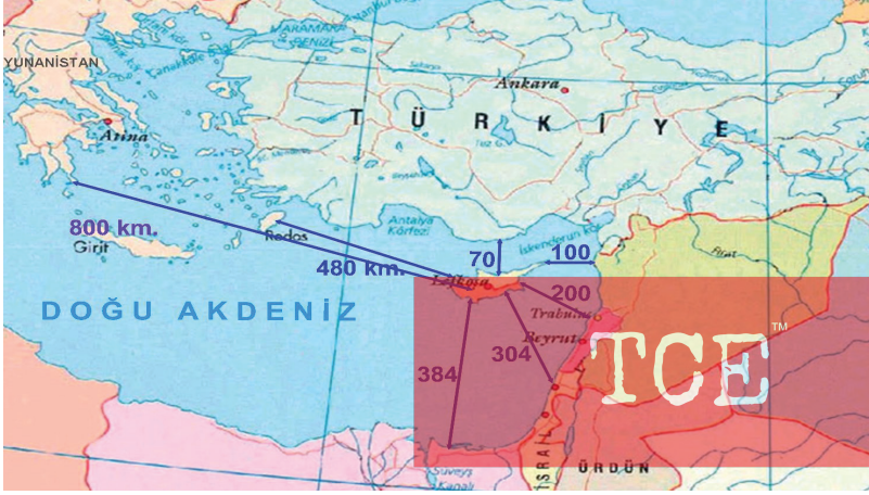
Harita 1. Kıbrıs'ın Komşu Ükelere Uzaklığı

Kıbrıs adasının 9251 km 2 olan yüzölçümünün günümüzdeki dağılımı şöyledir: